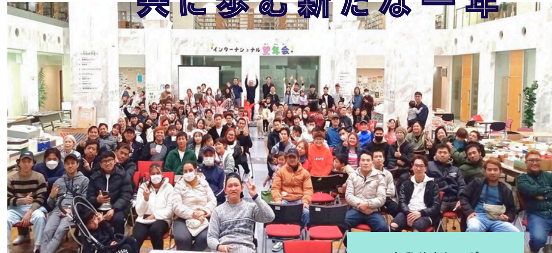
ねひめカレッジ ニュースレター