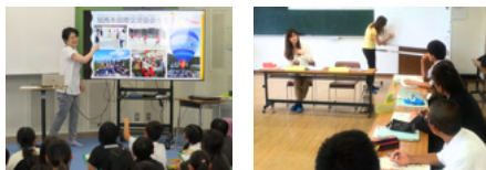
やさしい日本語講座 ポルトガル語研修

講師やボランティアが各種講座やイベントにご協力します。詳しくはお問合せください。