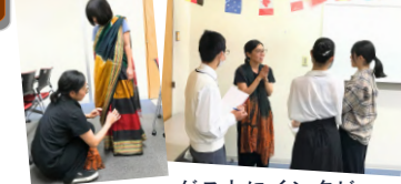
ゲストにインタビューする県立北条高校生